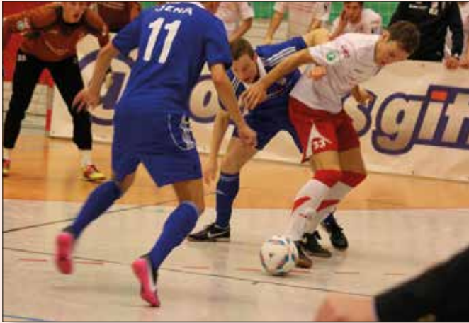
Ein ewig junges Duell: Der FC Rot-Weiß Erfurt gewann gegen den FC Carl Zeiss Jena und sicherte sich den Sieg beim 19. Hallenturnier des TFV in Erfurt.