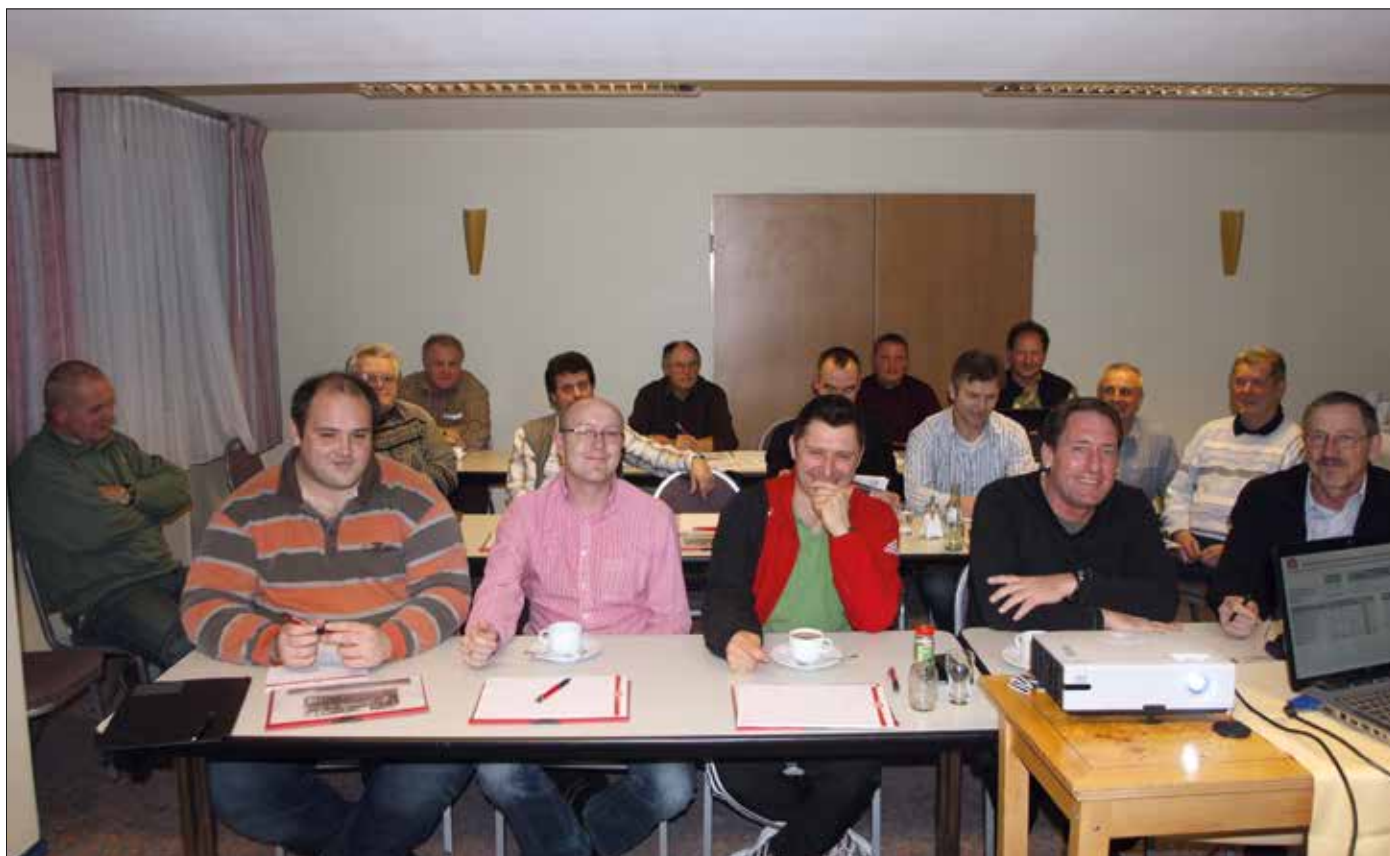
Weiterbildung: Auch Referenten müssen mitunter die Schulbank drücken.

40-Stunden-Programm zum Junior-Coach an den Sportgymnasien Jena und Erfurt. Jeder Schüler, der das Sportgymnasium verlässt, sollte eine Lizenz haben. Wir wollen in der Aus- und Fortbildung im Jahre 2014, ohne das ich das hier im Einzelnen aufliste, mit 210 Veranstaltungen im TFV rund 4400 Teilnehmer erreichen.