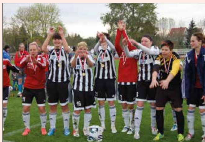
Seriensieger: Die Frauen des 1. FFV Erfurt gewannen erneut den Landespokal.