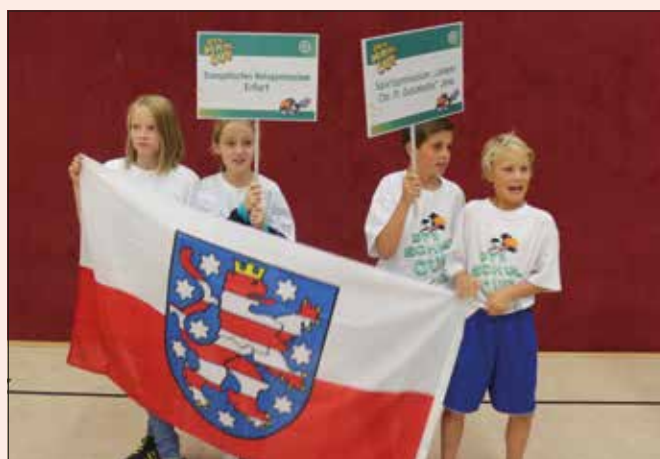
DFB-Schul-Cup in Bad Blankenburg: Das Sportgymnasium Jena belegte Platz drei bei den Jungen, die Mädchen des Ratsgymnasiums Erfurt wurden 15.