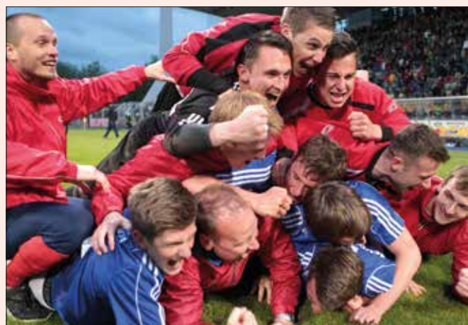
Sensation: Der Verbandsligist SV Schott Jena bezwang im Landespokal-Finale den Drittligisten FC Rot-Weiß Erfurt.